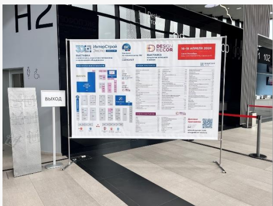
Мобильная конструкция из хромированных труб, размер баннера 2,9x1,95 м, одна сторона