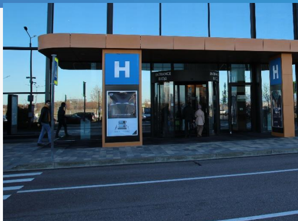
Рекламная конструкция, входная группа, 1,15x1,75м