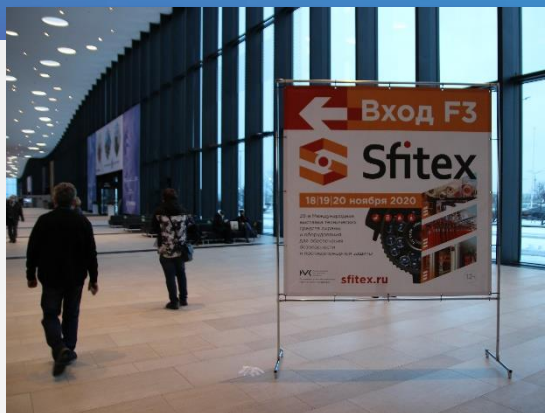
Мобильная конструкция из хромированных труб, размер баннера 1,95x1,95 м, одна сторона