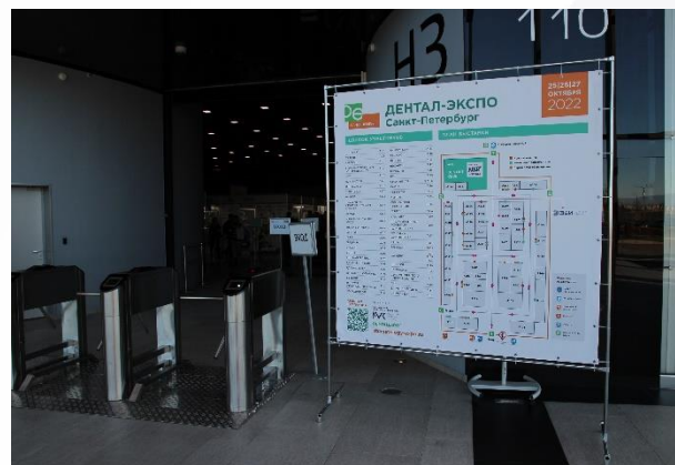
План выставки перед входом в павильон

Все цены, указанные в каталоге, не включают НДС. Крайний срок заказа услуг 27 февраля 2026 г.