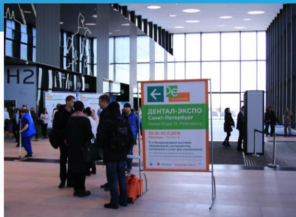
Мобильная конструкция из хромированных труб, размер баннера 1,18x1,6 м, одна сторона