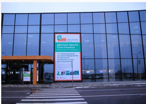
Реклама на половине фасадного баннера, 4,8x4,24м