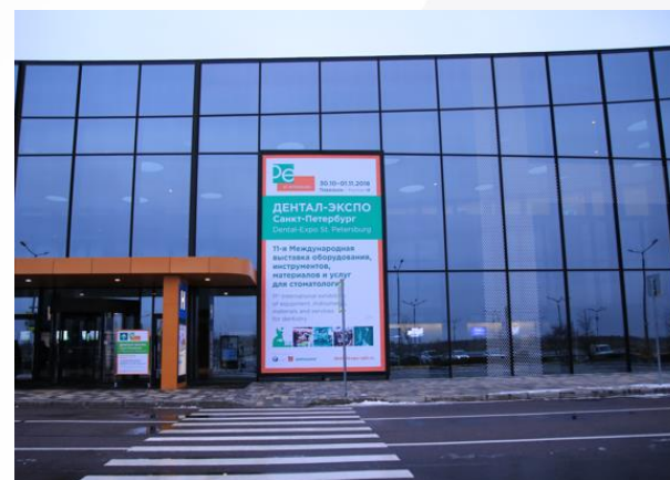
Реклама на целом фасадном баннере, 5,24x9,36м

Все цены, указанные в каталоге, не включают НДС. Крайний срок заказа услуг 27 февраля 2026 г.